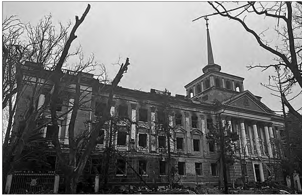
Такий вигляд має Адміралтейство після ворожих ударів.

для підприємства. З початку 1990-х років на території заводу перебуває ракетний крейсер.