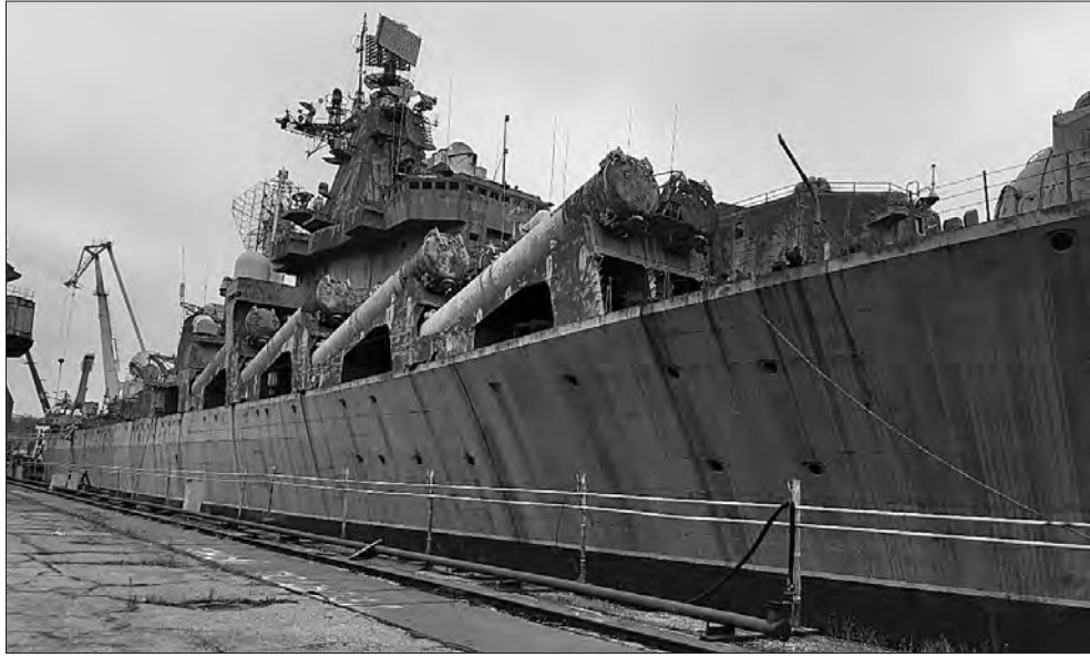
Сумнозвісний безіменний ракетний крейсер досі на території заводу.

До всіх внутрішніх та зовнішніх проблем заводу додаються ще багатолітні «якорі», які стали справжніми тягарями