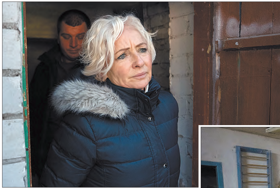
Спікерка Сaeйми Латвійської Республіки Дайга Мієрїна.

Кожен другий латвієць нині донатить на Україну. Ця країна прийняла рішення про конфіскацію майна російської федерації та очолила так звану коаліцію дронів. Підтримку дружнього нам народу ми відчуваємо від урядових та волонтерських організацій, і така допомога з боку Латвії є надважливою, тому що вона служить прикладом