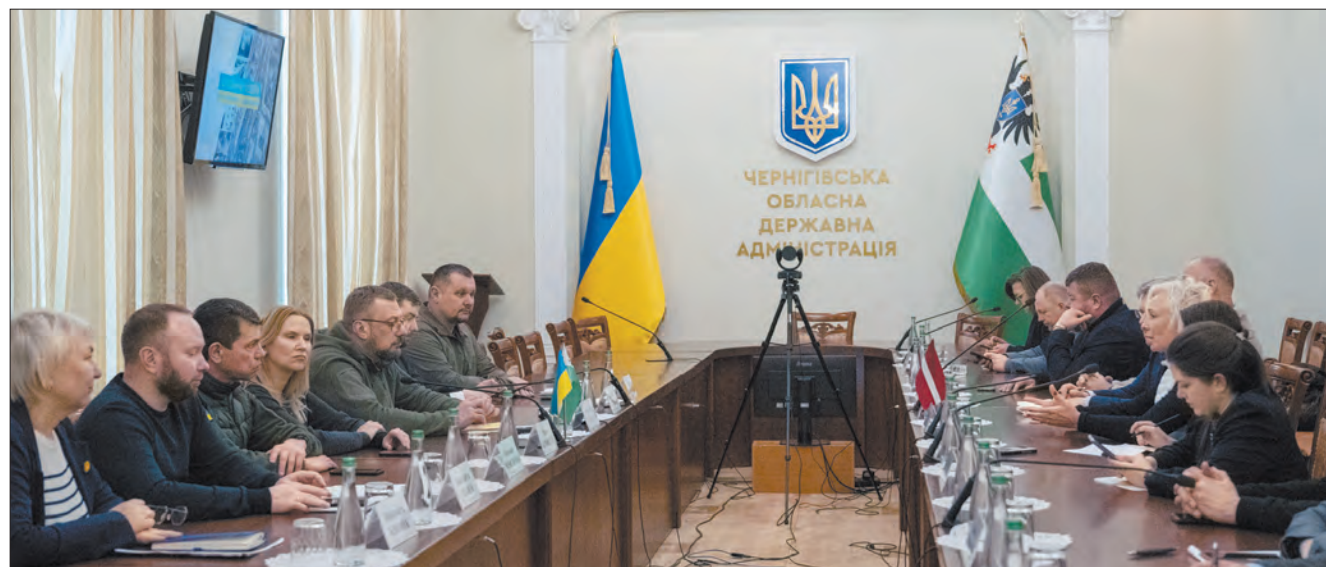
Нарада в Чернігівській обласній військовій адміністрації.

вою, тому що вона служить прикладом для інших країн. Якби всі наші союзники виділяли нам на допомогу стільки відсотків ВВП, як Латвія, ми давно перемогли б у цій війні».