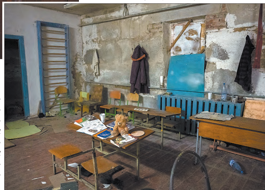
Підвал катівні у школі села Ягідне Чернігівського району.