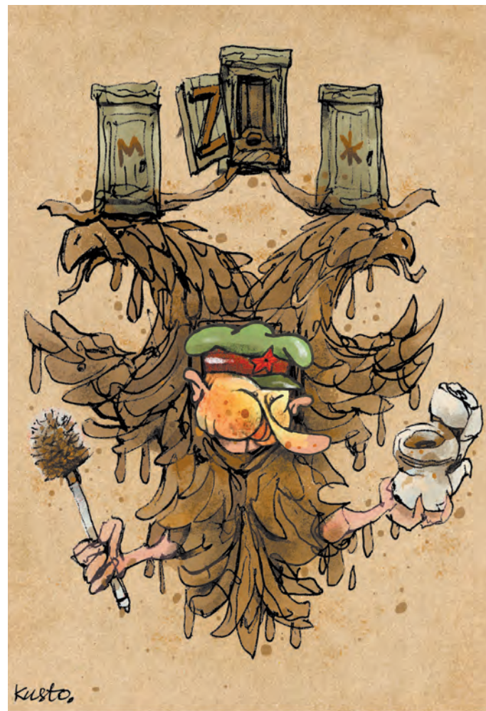
Гендерно нейтральна імперія.